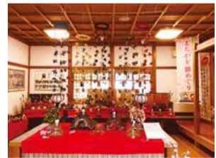
つるし雛と老舗のコラボ