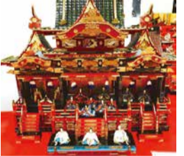
江戸から昭和の人形展