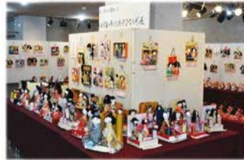
小学生創作ひな人形展