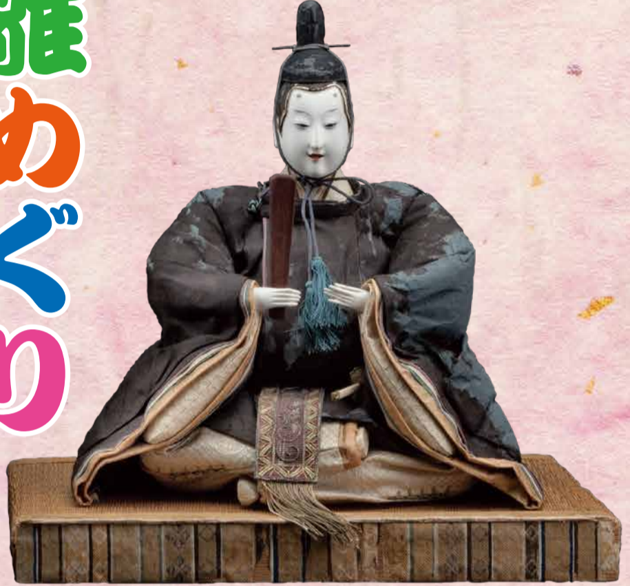
古今雛 江戸時代 さいたま市岩槻人形博物館蔵